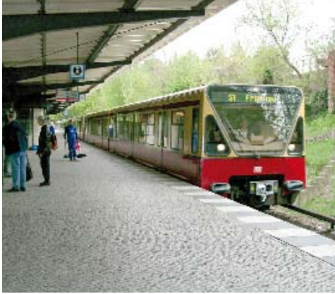
Eine bessere Abstimmung von Bus- und Bahn-Fahrplänen wäre möglich.

Der Tegeler Forst ist auch weiterhin als Naherholungsgebiet von Bedeutung. Der Waldparkplatz an der Roten Chaussee muss in angemessener Größe wiederhergestellt werden. Der dort gelegene Trimm-