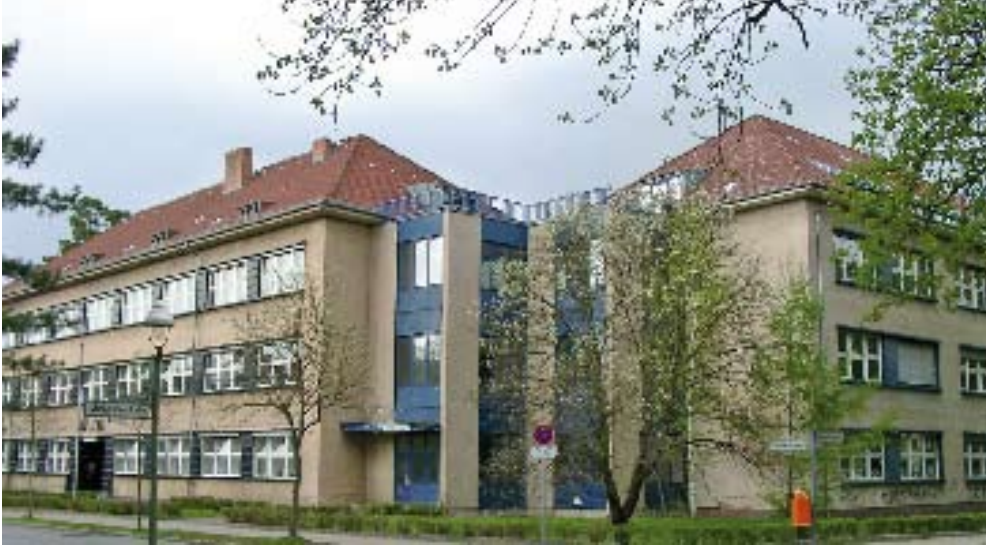
Die Schulen Frohnaus gehören zu den herausragenden Schulen ihrer Art in Berlin.

ten, setzt sich die CDU in Frohnau und im Bezirk Reinickendorf ein. Auf Grund der vorrangigen Zuständigkeit des Berliner Schulsenators für die Profilbildung der Schulen unterstützt die CDU im Berliner Abgeordnetenhaus die Beibehaltung der besonderen Profile für die beiden Frohnauer Grundschulen.