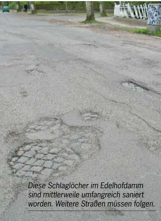
Diese Schlaglöcher im Edelhofdamm sind mittlerweile umfangreich saniert worden. Weitere Straßen müssen folgen.

Eine Umstellung von Gas- auf elektrische Laternen kann – wenn sie denn ökologisch und ökonomisch sinnvoll ist – nach unseren Vorstellungen finanziell nicht auf