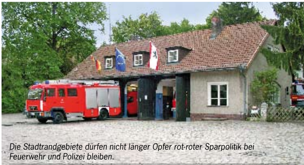
Die Stadtrandgebiete dürfen nicht länger Opfer rot-roter Sparpolitik bei Feuerwehr und Polizei bleiben.

Die Freiwillige Feuerwehr Frohnau muss ihren hohen Standard und ihren Stellenwert im Sicherheitskonzept für den Berliner Norden behalten. Wir ermuntern alle