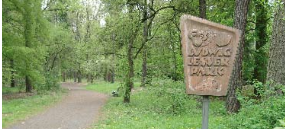
Ludwig Lessers Gartenanlagen prägen noch heute das Ortsbild Frohnau.