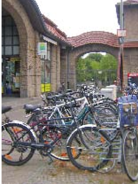
Die CDU hat sich für eine Entspannung der beengten Fahrradstellplatzsituation am S-Bahnhof eingesetzt.

Der in Regie des Landes Brandenburg vollzogene Umbau der Straßenkreuzung Fürstendamm/B96 und die damit verbunde-